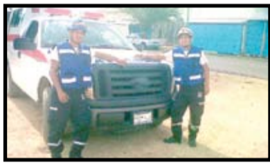
Cubriendo a Organizaciones Sociales en la Cámara de Diputados Oaxaca, Marzo del 2012.