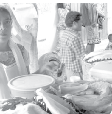
El tradicional, de leche, nuez, agua miel, chocolate, avellana, uva, piña, coco, durazno y almendra; así como otros productos derivados del maíz como: tortillas en sus diferentes variedades, atole, tejate, tamales, tostadas.