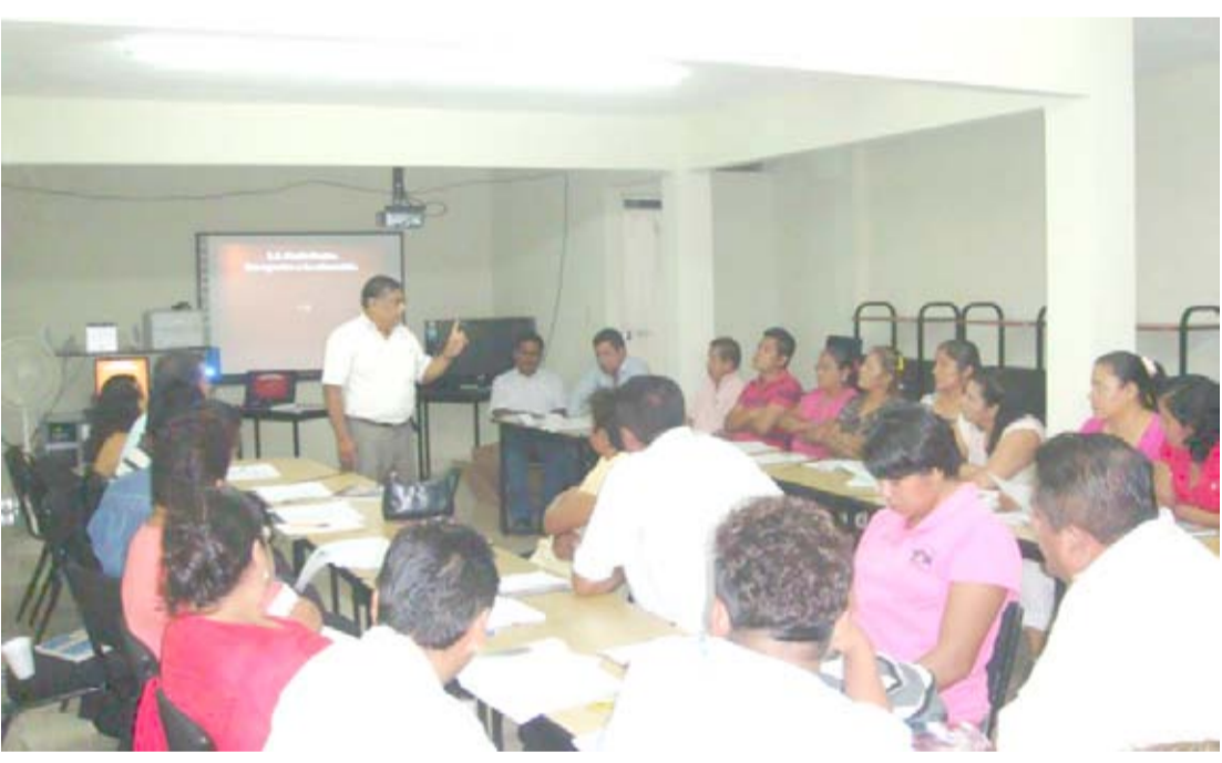
Desarrollo de los Talleres Estatales de Educación Alternativa en el Centro de Maestros de la Región de Tuxtepec