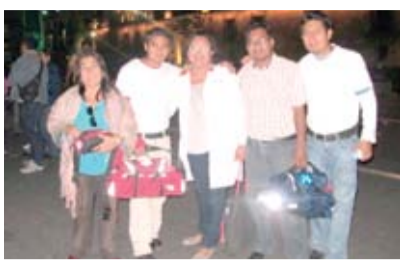
Cobertura de actividad realizada en el marco del paro de 48 hrs en la ciudad de México, febrero 2012.

D ENTRO DE las actividades del Servicio Médico de la Secretaría de Previsión y Asistencia Social se encuentra coberturar las actividades que emanan de los acuerdos de las Asambleas Estatales, al inicio de la presente gestión en el 2008 esta Secretaría contaba con el apoyo de dos médicos, los cuales eran insuficientes para la atención de dichas actividades ya que se contemplan un alto porcentaje