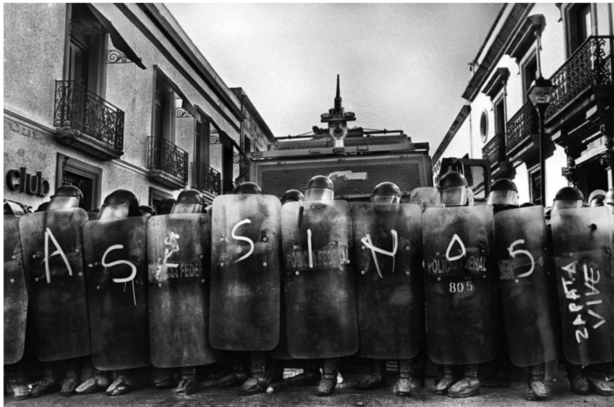
Autor: Antonio Turok. Oaxaca