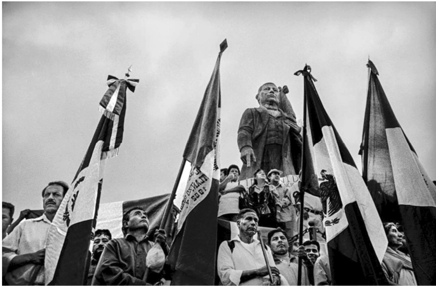
Autor: Antonio Turok. Oaxaca.