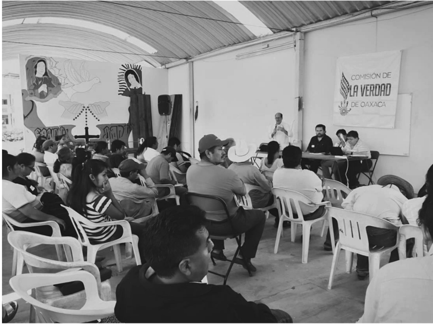
Sesión itinerante. Putla, Oaxaca