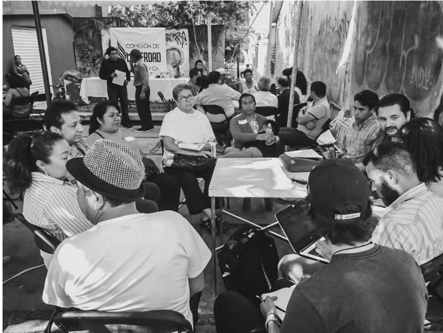
Sesión itinerante. Fracc.El Rosario, SanSebastián Tutla