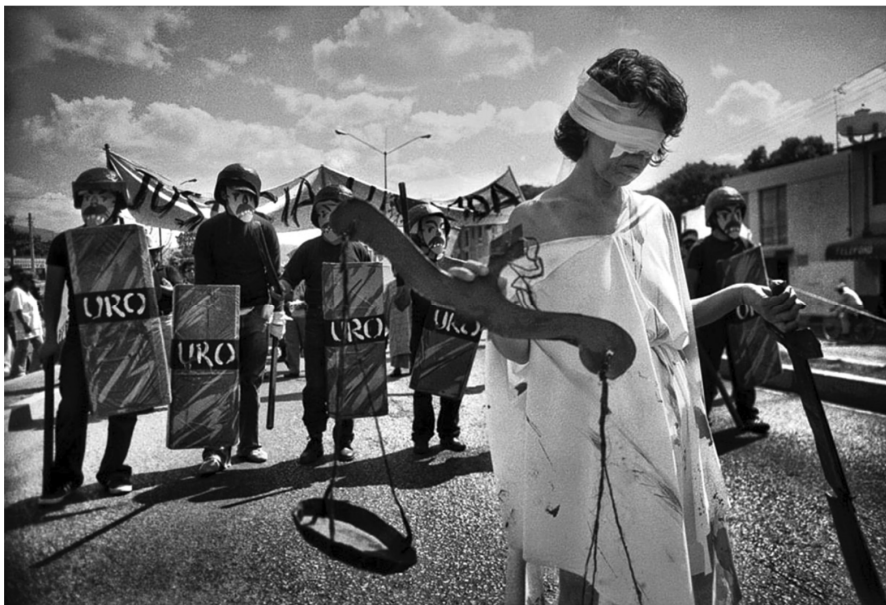
Autor: Antonio Turok. Oaxaca.