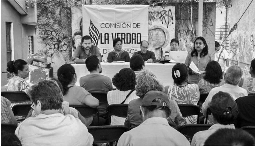
Sesión itinerante. Fracc. El Rosario, SanSebastián Tutla.