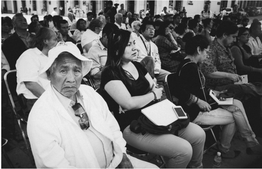
Foro público ¡Nunca más!2006.."Por la Verdad, la Justicia y la Reparación".