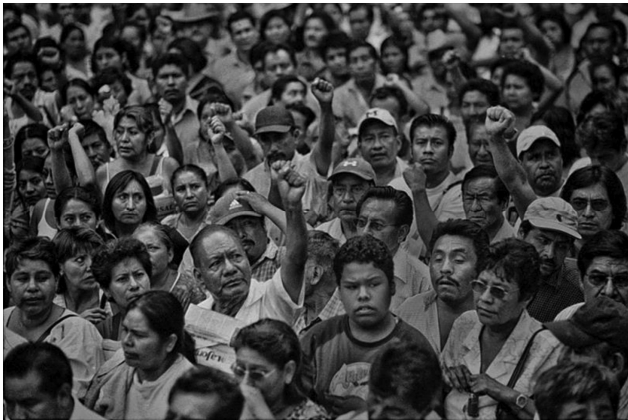
Autor: Antonio Turok. Oaxaca.