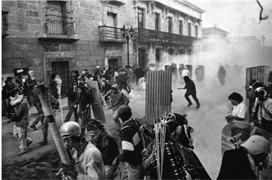
Autor: Antonio Turok. Oaxaca