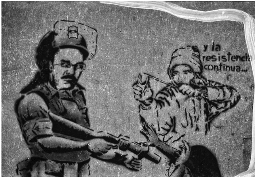
Autor: Antonio Turok. Oaxaca.