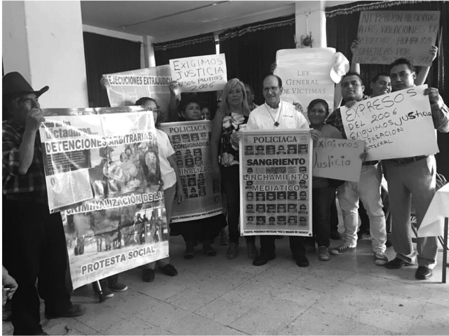
Sesión itinerante. Huajuapam, Oaxaca