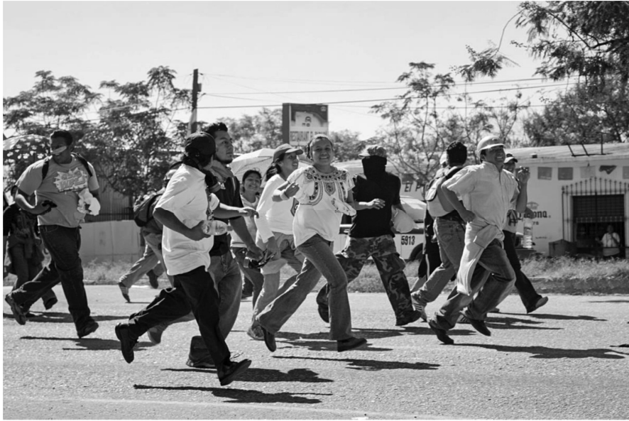
Autor: Hinrich Schultz.