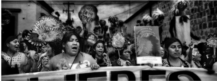
Autor: Antonio Turok. Oaxaca