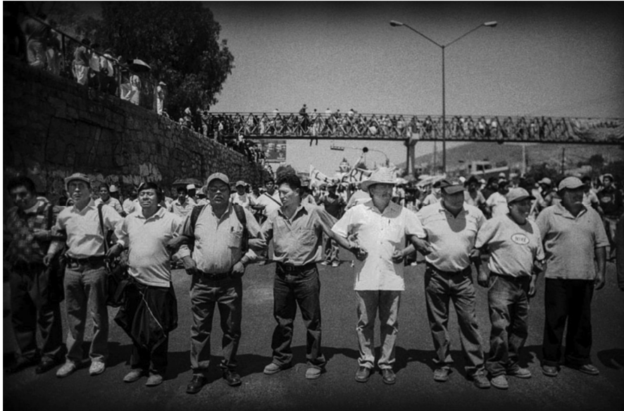
Autor: Antonio Turok. Oaxaca