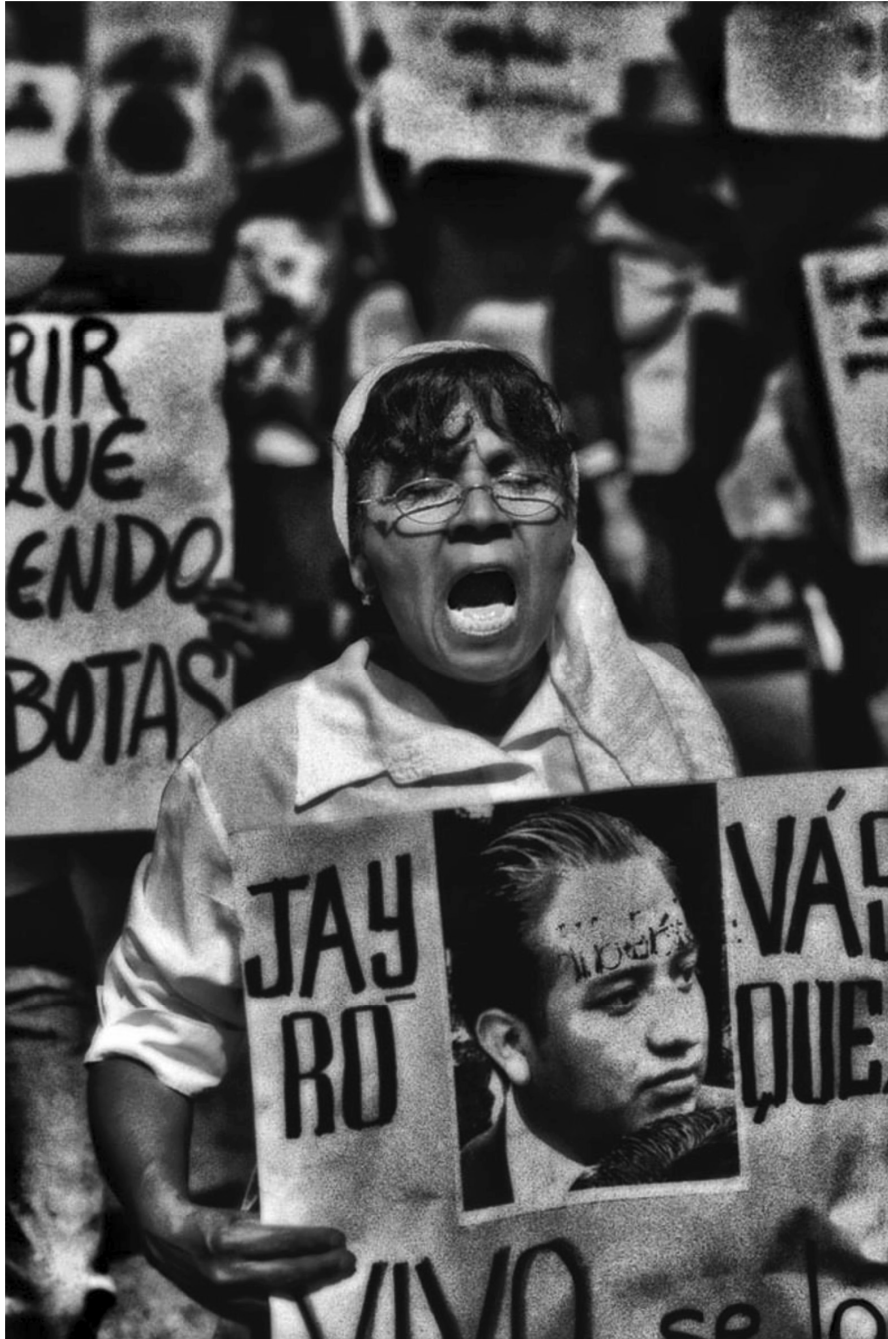
Autor: Antonio Turok. Oaxaca.