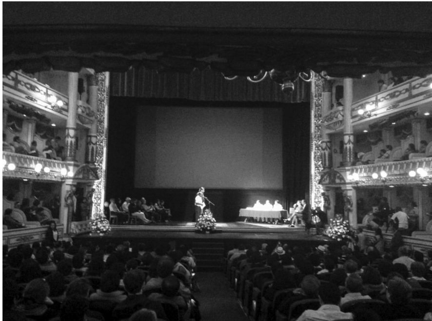
Sesión pública 14 junio 2015. Teatro Macedonio Alcalá, Oaxaca.