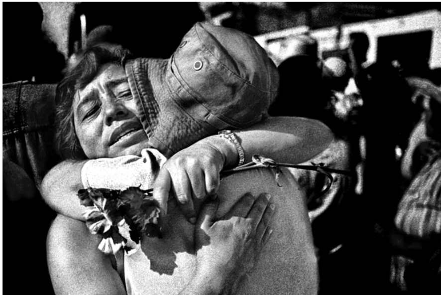
Autor: Antonio Turok. Oaxaca