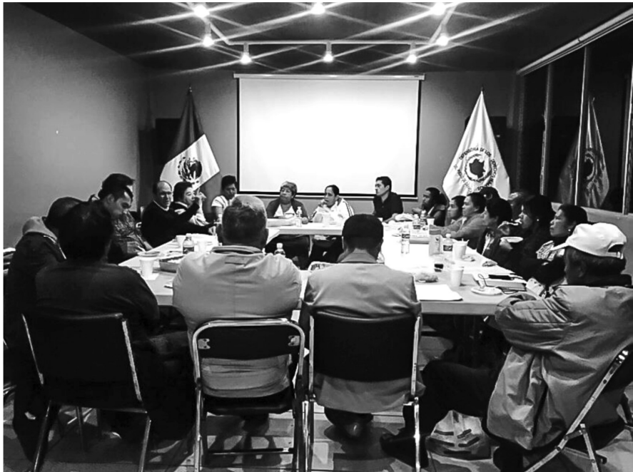
Sesión con víctimas en la Defensoría