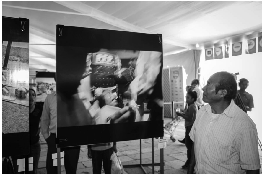
Exposición fotográfica "Miradas de Resistencia y Esperanza".